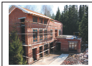
СТРОЙКА «ДОМА РАДУЖНОГО ДЕТСТВА» ПРОДОЛЖАЕТСЯ